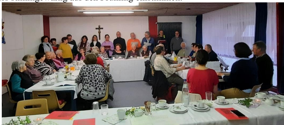
Mitglieder des Kirchenchors Tandern (hinten stehend) sangen mit den Senioren der Pfarrei Tandern.